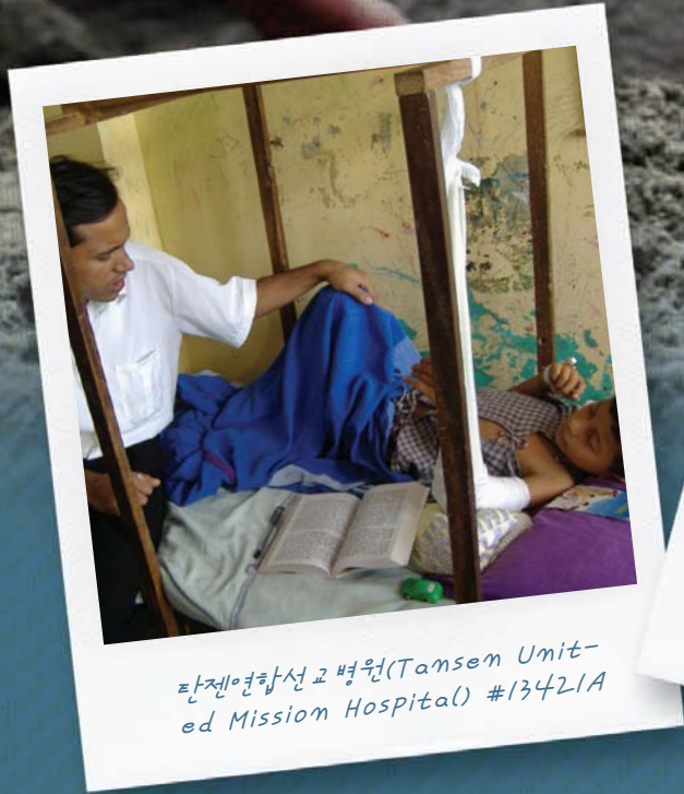
탄젠연합선교병원(Tansem United Mission Hospital) #13421A