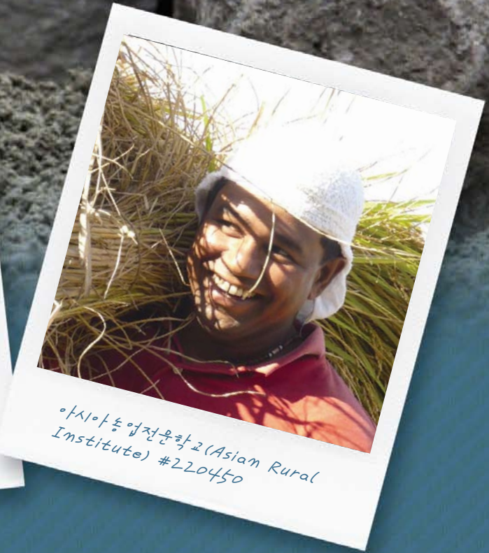
아시아동업전문학교(Asian Rural Institute) #220450